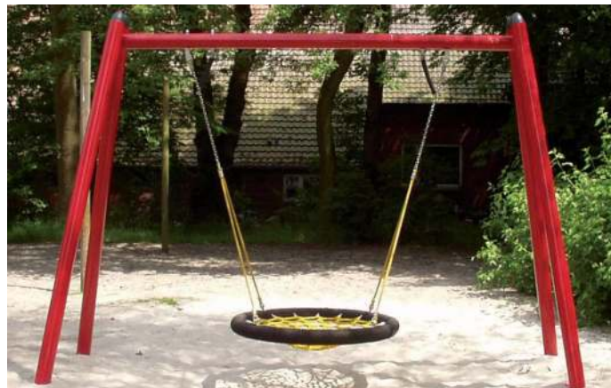
Premium Nestschaukel Fa. espas

Hier ist das teure Gerät nun endlich im Dauereinsatz bei den großen und auch bei den kleinen Kindern. Das Gerät wird auch im Sportunterricht mit benutzt. Und nachmittags versuchen sich auch gerne heranwachsende auf dem Gerät. Genau so hatte ich es mir auch ursprünglich vorgestellt.