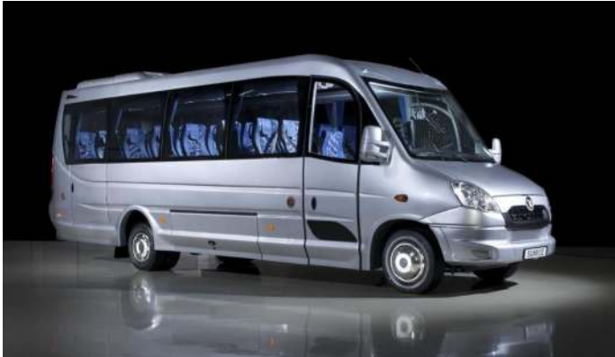
Modell "Sunrise" Fa. Omnibus-Trading B.V.

Inzwischen wird unser neuer Schulbus endlich produziert und wir erwarten die Auslieferung Ende Mai bis Anfang Juni. Sollte unser alter Schulbus vorzeitig ausfallen, hat mir die Lieferfirma zugesagt, ersatzweise mit einem Fahrzeug auszuhelfen.