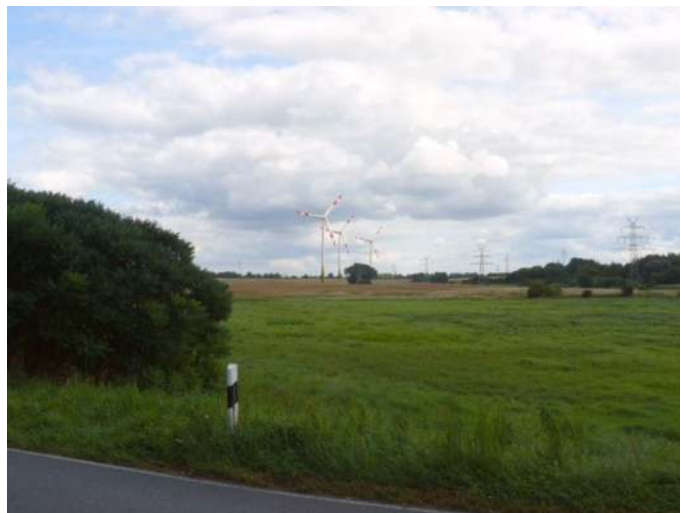
Visualisierung der Anlagen vom Ortsausgang Flemhude Richtung Melsdorf

Welcher Anlagentyp letztendlich zum Einsatz kommen soll, wird uns ein Vertreter der Planungsgesellschaft Denker&Wulf bei der nächsten Bürgerversammlung vorstellen, wenn die Höhenfrage geklärt ist. Anwohner von Windkraftanlagen sagen jedenfalls durchweg, dass eine stärkere visuelle Belästigung durch die Erhöhung des Turms um 15 m mit dem bloßen Auge nicht erkennbar ist.